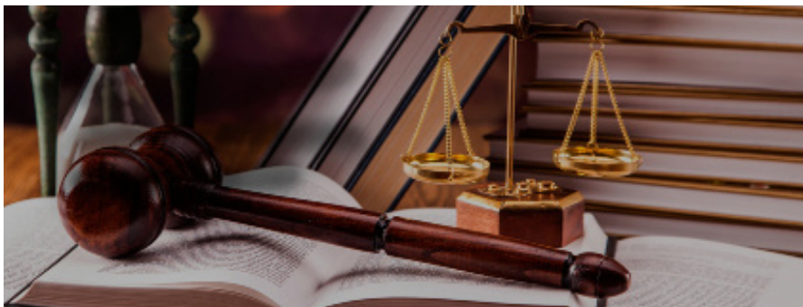
Морозова Светлана, юрист

Нарушение логистических цепочек, вызванное ограничениями на перелёты и наземные передвижения транспортных средств и грузов, сложности с оплатами из-за отключений банков от международных платёжных систем и повышение рисков неплатежеспособности контрагентов, уход из страны ключевых иностранных компаний — всё это поставило под сомнение оперативное и надлежащее исполнение предпринимателями своих обязательств по договорам. Проблемы коснулись как фактического исполнения в виде пре-