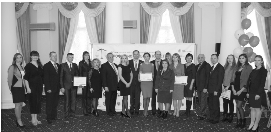
Церемония награждения финалистов I Севастопольского регионального конкурса «Профессиональный юрист» в 2017 году.