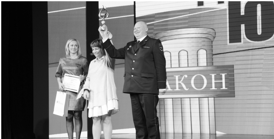
Награждение финалистов I Крымского регионального конкурса «Профессиональный юрист» в 2018 году.