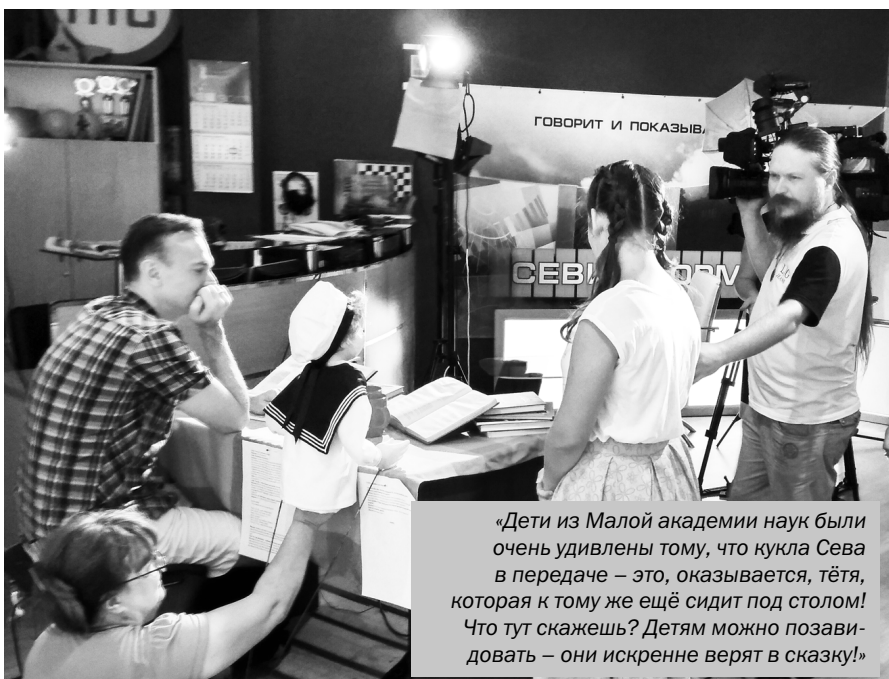
«Дети из Малой академии наук были очень удивлены тому, что кукла Сева в передаче – это, оказывается, тётя, которая к тому же ещё сидит под столом! Что тут скажешь? Детям можно позавидовать – они искренне верят в сказку!»