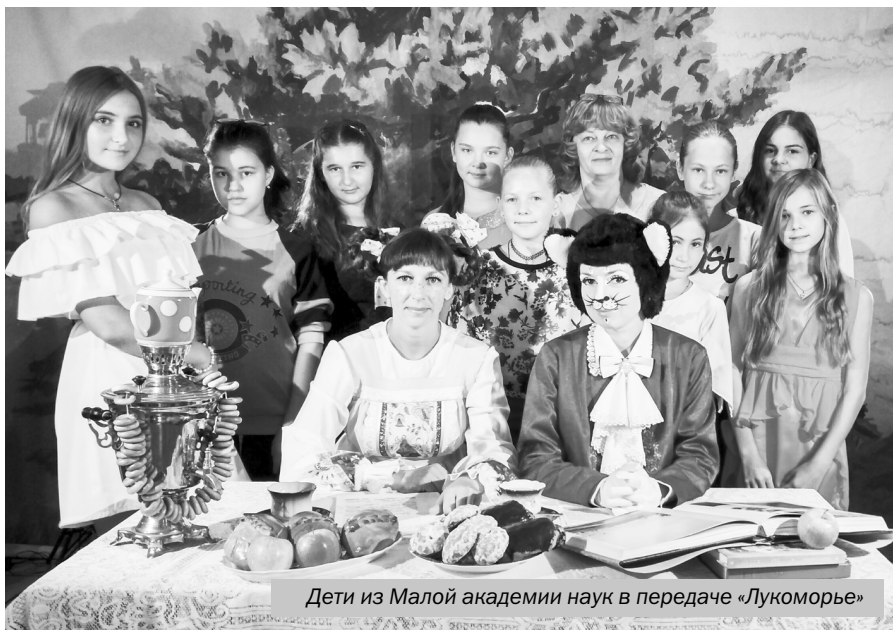
Дети из Малой академии наук в передаче «Лукоморье»